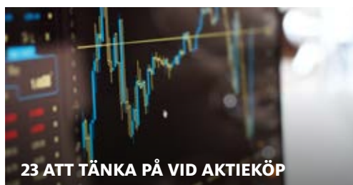
23 ATT TÄNKA PÅ VID AKTIEKÖP